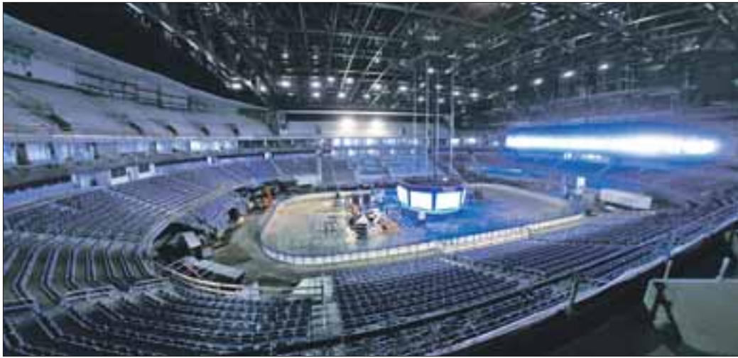
Trotz der noch leeren Plätze beeindruckt die O 2 World. Ab Herbst können bis zu 17 000 Besucher Konzerte und Sport- sowie Unterhaltungsveranstaltungen in der Halle erleben.