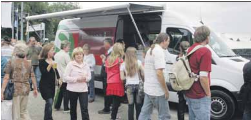
17 000 Besucher kamen zum Open-Air-Event, 2000 Abo-Kunden der S-Bahn Berlin waren unter den Zuschauern, da sie ihre Eintrittskarten gewonnen hatten.