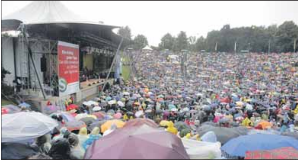
Die Stars schauten auf ein buntes Meer von Regenschirmen – der Stimmung tat das trotz kurzer Regenschauer keinen Abbruch.

Dafür sorgten die Auftritte von Bonnie Tyler, Shakin' Stevens, der Münchener Freiheit, der Goombay Dance Band und Middle of the Road. Unter den 17 000 Zuschauern in der ausverkauften Kindl-Bühne Wuhlheide waren auch 2000 Abo-Kunden der S-Bahn Berlin, die ihre Karten gewonnen hatten.