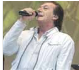
Frontsänger der Münchener Freiheit Stefan Zauner