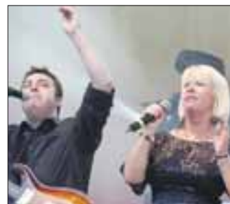
Middle of the Road