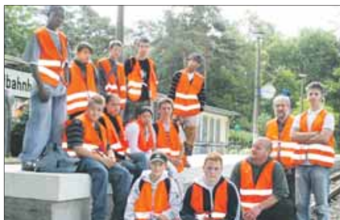
Gleise vom Wildwuchs befreit - die 7. Klasse aus Lichtenberg

Denn dieser Einsatz findet im Rahmen einer Initiative der Berliner Polizei (Operative Gruppe Jugendgewalt, Direktion 6) und des Berliner Senats statt. Unter dem Motto: „Gemeinsam Leistung zeigen“ werden Schüler angehalten, ihre schulischen Leistungen zu steigern und zu zeigen, dass sie in der Lage sind, ihr soziales Verhalten, geprägt durch respektvolles Miteinander, Rücksichtnahme und gemeinsame Interessen, positiv zu verändern. Dafür werden die Schüler belohnt, mal mit einer durch ein Lichtenberger Unternehmen gesponserten Kanufahrt oder mit dem Besuch eines Gerichtes und heute eben