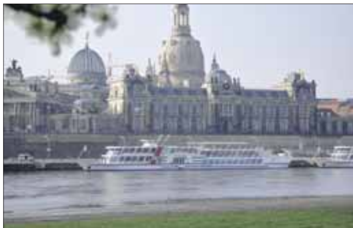
Per Bus gehts auch nach Dresden.

Infos und Fahrpläne unter www.BerlinLinienBus.de und telefonisch unter ☎ (030) 86096211