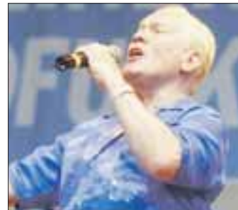
Sänger der Goombay Dance Band Oliver Bendt