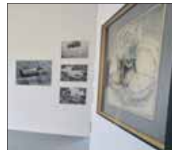
Blick in die restaurierten Ausstellungsräume