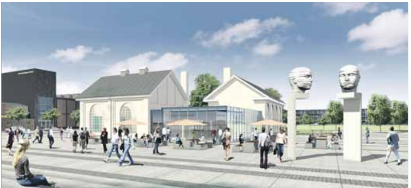
Der zentrale Stadtplatz Forum Adlershof, wie er bald aussehen wird...

Die zwei beweglichen Köpfe auf dem gerade eingeweihten zentralen Forumplatz scheinen nachdenklich. Zweifel am Erfolg des städtebaulichen Entwicklungsbereichs Johannisthal/Adlershof können das kaum sein. Der Senat von Berlin – und damit letztlich der Steuerzahler – hat in beträchtlichem Umfang Geburtshilfe für den Standort geleistet, das Baby ist ein Teeny geworden, der zu großen Hoffnungen Anlass gibt. Noch längst sind nicht alle Möglichkeiten des Standortes ausgereizt. Der Teenager kann, nein, wird noch wachsen.“