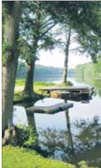
In Alt Madlitz erwartet den Gast eine Oase der Erholung