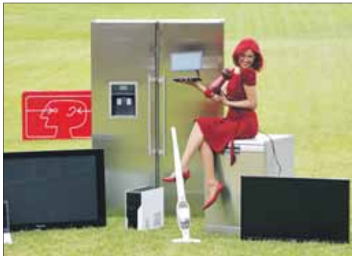
Neu auf der IFA: Haushaltsgeräte

Navis – wie sie fast schon liebevoll genannt werden – sind in diesem Jahr garantiert die Publikumshighlights der IFA. Präsentiert werden sie in der mit etwa 7 674 Quadratmetern zweitgrößten Halle auf dem Berliner Messegelände. Die Ausstattungsmerkmale und die Modellvielfalt bieten einen Komfort, der weit über die reine Wegweisung hinausgeht. Die IFA-Neuheiten der Navigation zeigen die Route anschaulich auf großen, hellen 16:9-