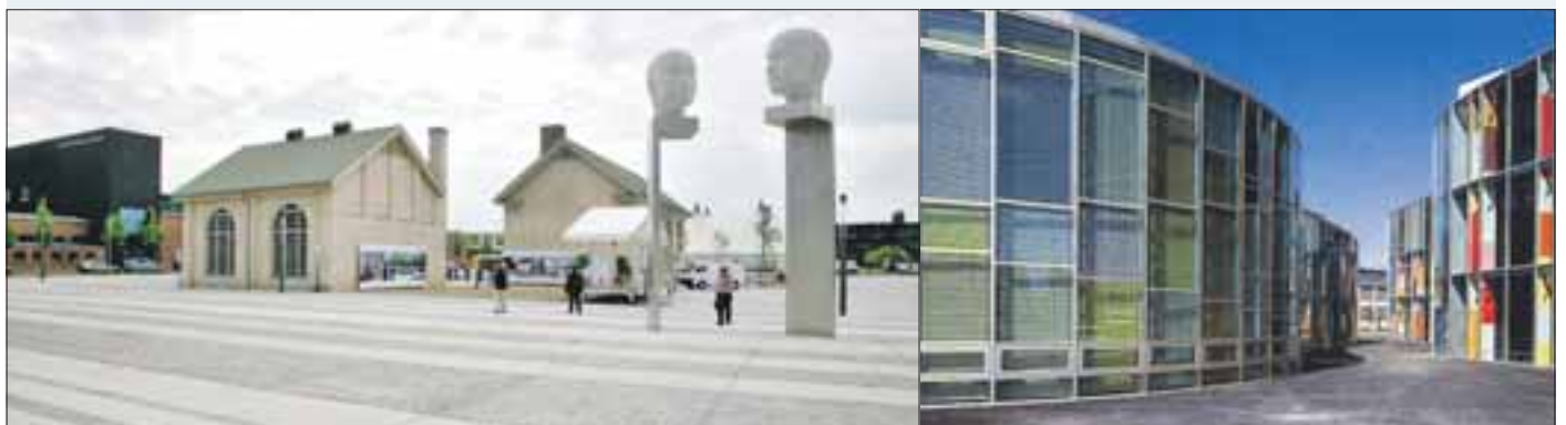
...und wie er bereits heute besteht.